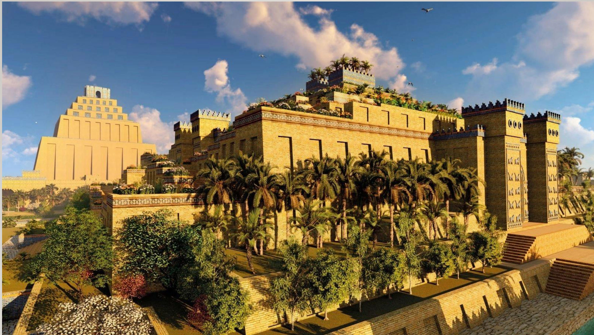
Les jardins suspendus de Babylone