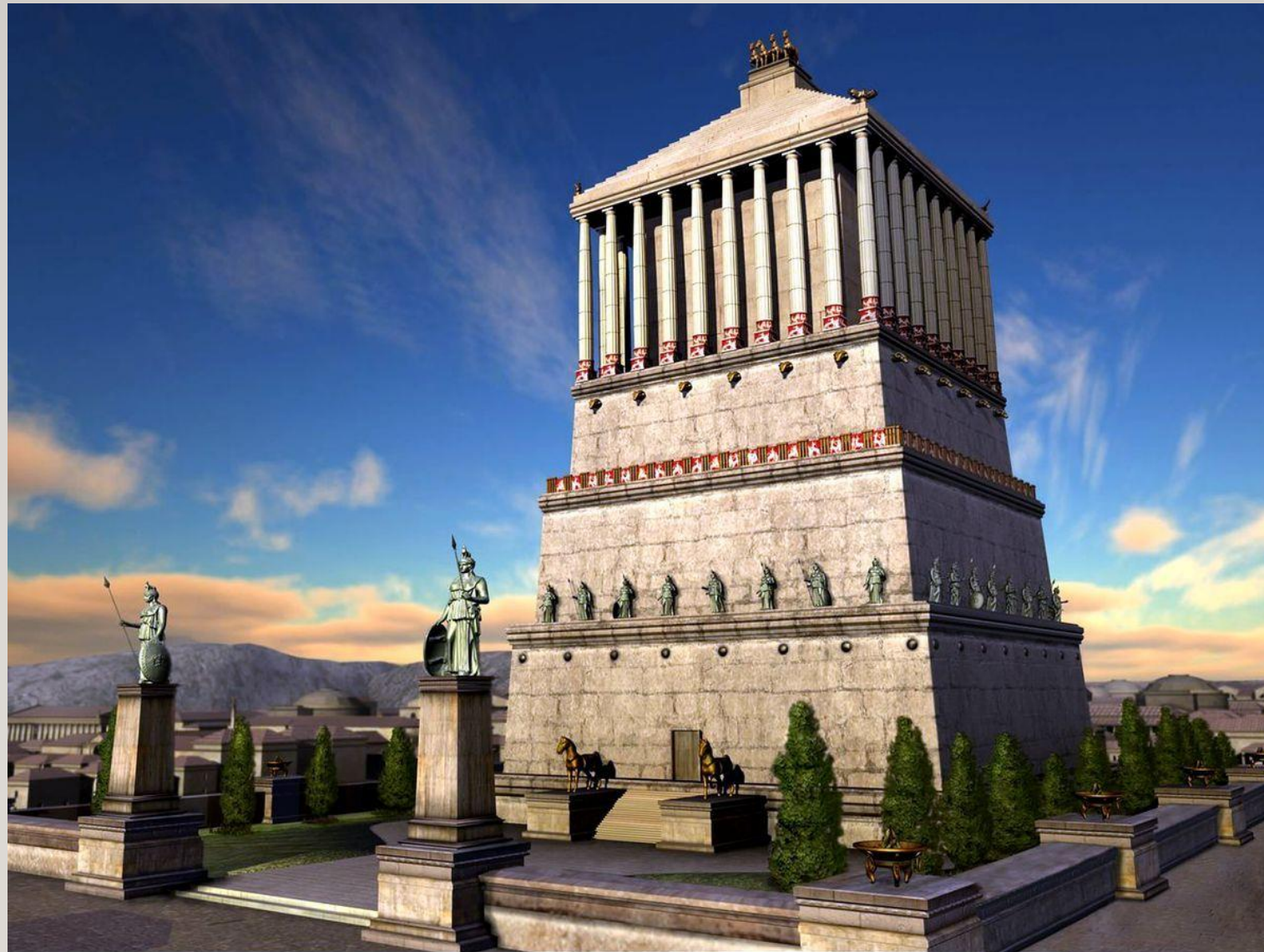
Le Mausolée d'Halicarnasse