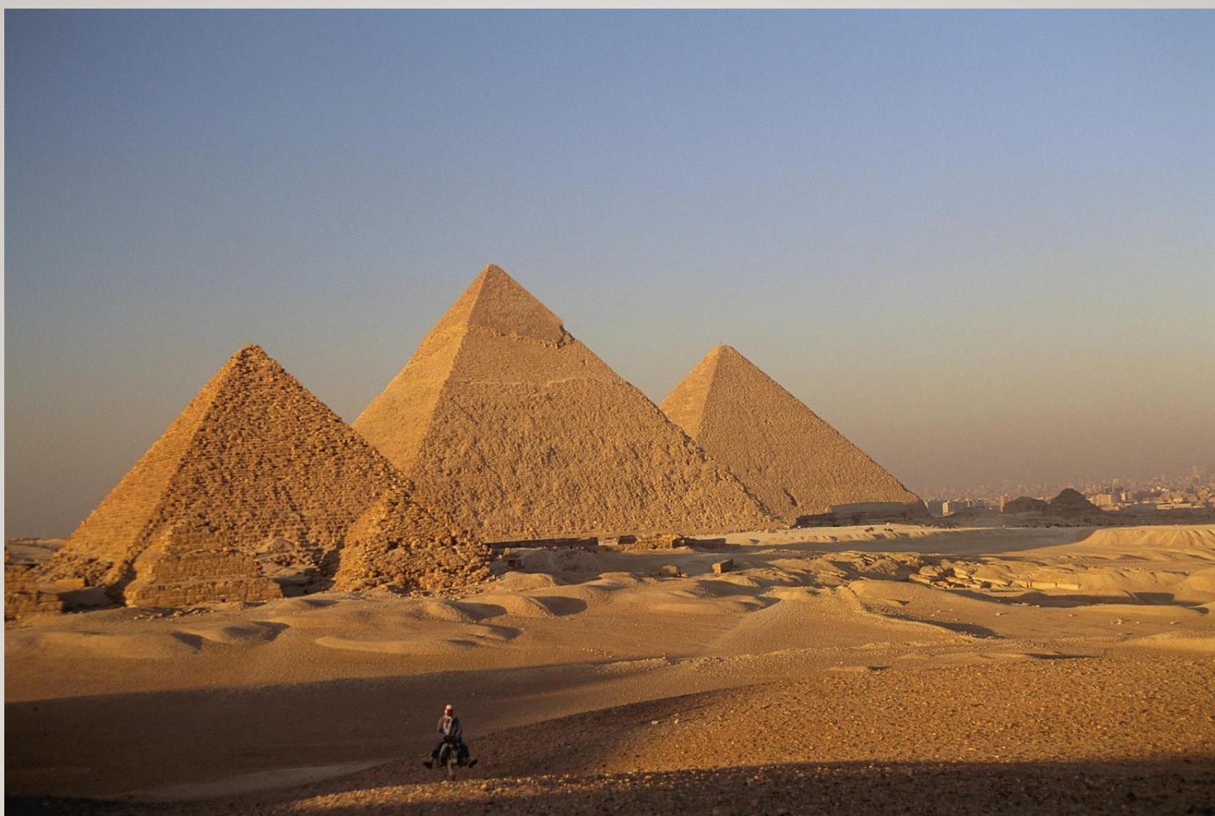
La Pyramide de Khéops