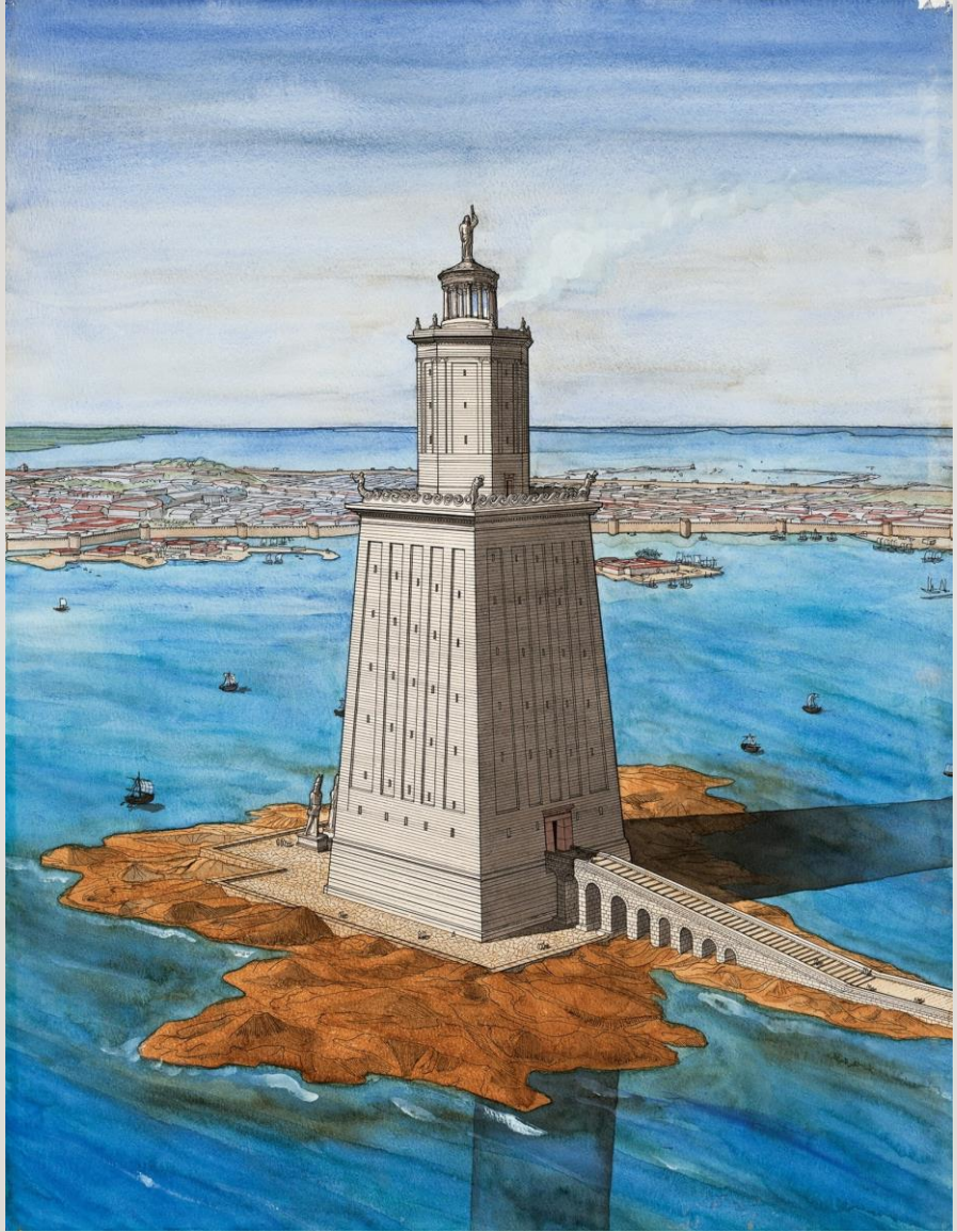
Le phare d'Alexandrie