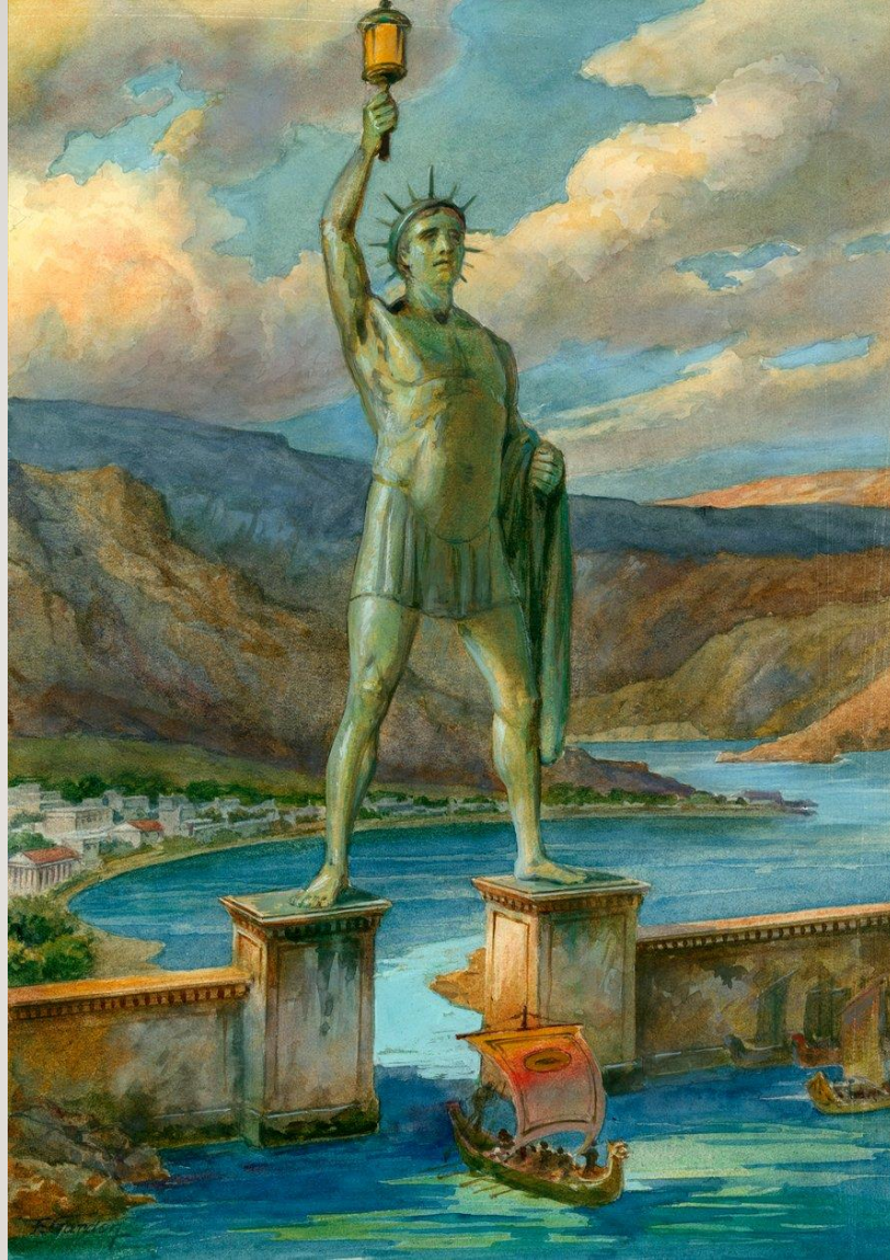
Le Colosse de Rhodes