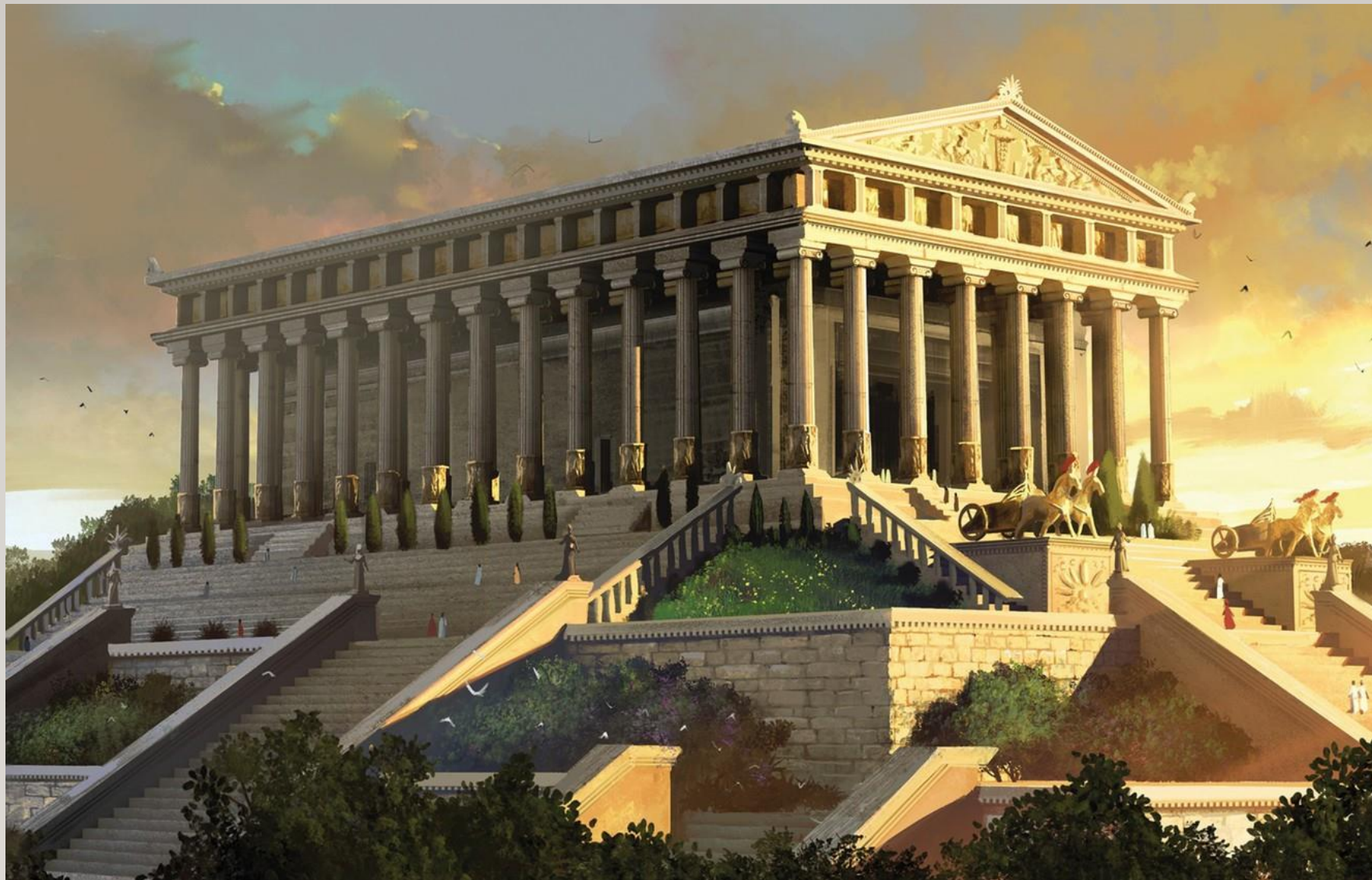
Le temple d'Artémis à Éphèse